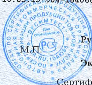
Схема сертификации 3. Упаковка, срок годности и условия хранения в соответствии с ТУ 10.83.13-004-18406694-2016